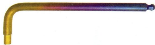
チタン合金製ボールポイント六角棒レンチ Titan Alloy Ball Point Hex-L-key